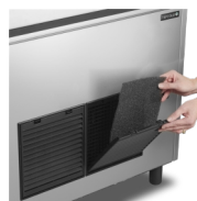
Kondensatorfilter er nemt at rengøre